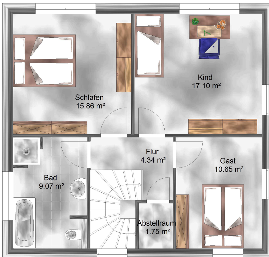
Abbildung enthält Sonderleistungen