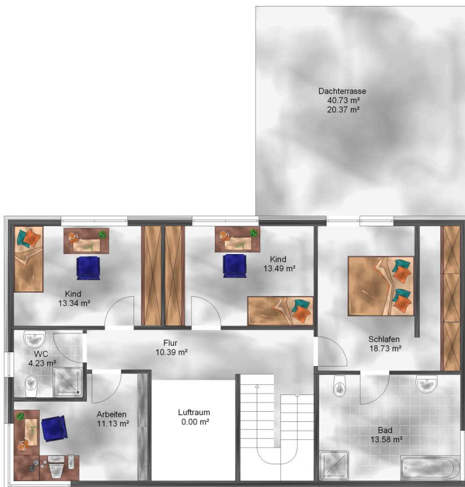
Abbildung enthält Sonderleistungen