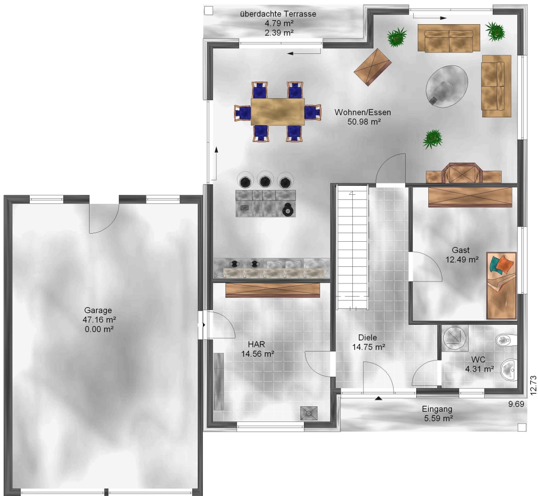
Abbildung enthält Sonderleistungen